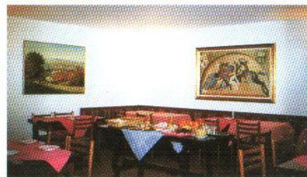
Sala prima colazione

Grazie alla sua posizione strategica e alle comode vie di comunicazione, si può raggiungere in soli 5 minuti il centro di Alba e, allo stesso tempo, Barolo, La Morra, Serralunga, Monforte, Barbaresco, Neive.