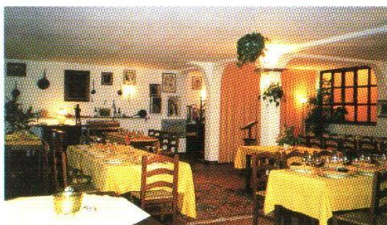
Sala ristorante-enoteca: piatti tipici, degustazione vini

L'Enomotel si trova ai piedi del borgo medioevale di Roddi, il cui castello ospitò il celebre filosofo Francesco della Mirandola.