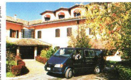
Servizio navetta minibus 9 posti